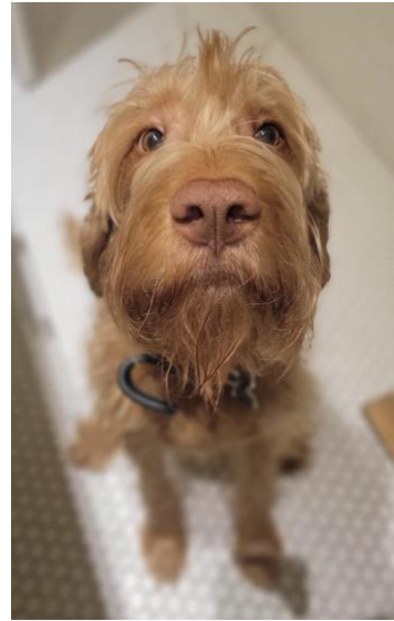
Bali et son regard perçant