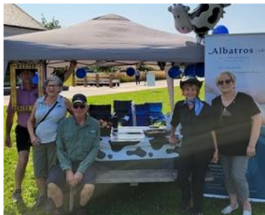
Albatros Lévis attend les marcheurs!

La marche du grand défolement organisée par la Fondation québécoise du cancer - 2024