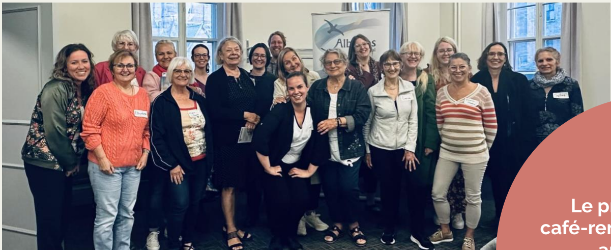
Une trentaine de personnes ont participé au café-rencontre du 25 mai dernier.